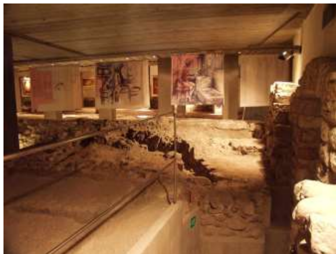
Zone souterraine Romaine de Trento