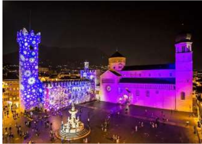
Trento Place du Dôme de Trento